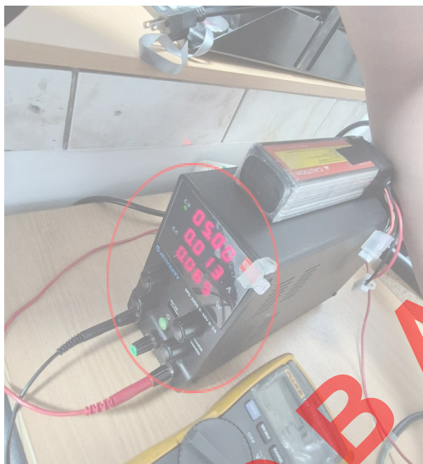
Figura 1. Valor de energización para la celda.