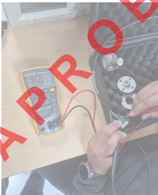
Figura 4. Valor de resistencia de salida de la celda.