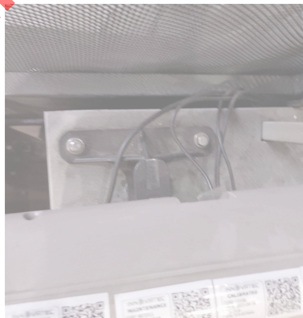
Figura 1. Mantenimiento preventivo básico