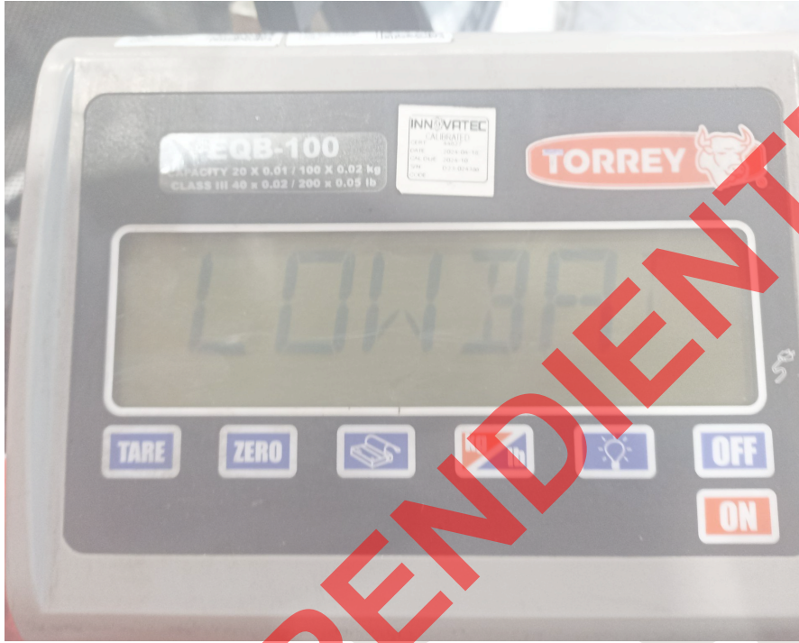
Vista General del equipo.