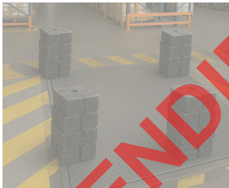
Vista General del equipo.