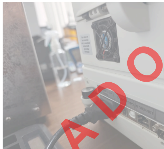
Vista General del equipo.