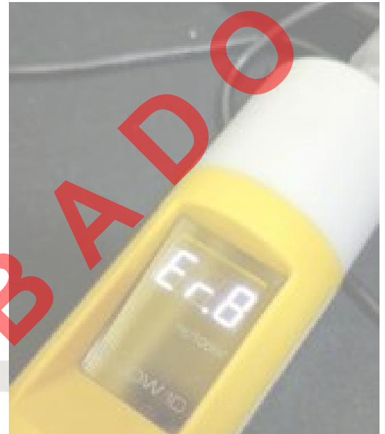
Fig. 2 Vista superior (Boquilla)