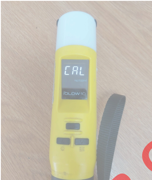
Fig. 1 Vista general del Equipo