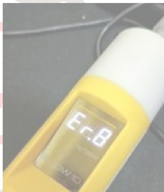
Fig. 4 Prueba patrón