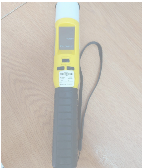
Fig. 1 Vista general del Equipo