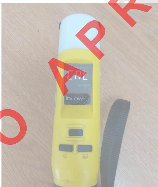
Fig. 3 Desbloqueo