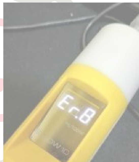
Fig. 4 Prueba patrón