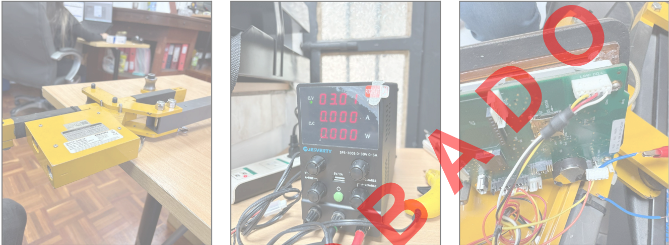
Fig. 1 Revisión técnica