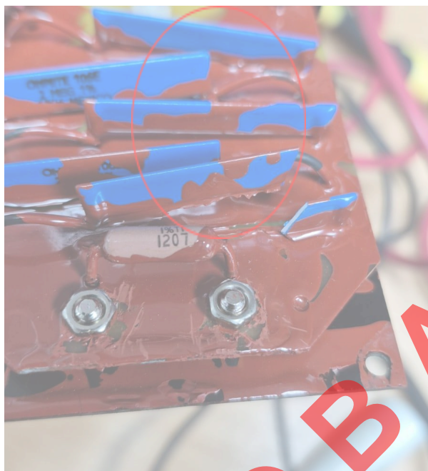
Figura 1. Resistencia dañada.