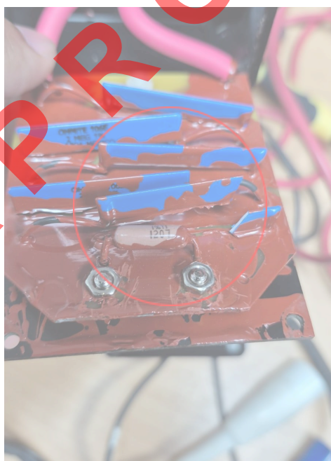
Figura 2. Estado de la placa electrónica del equipo.