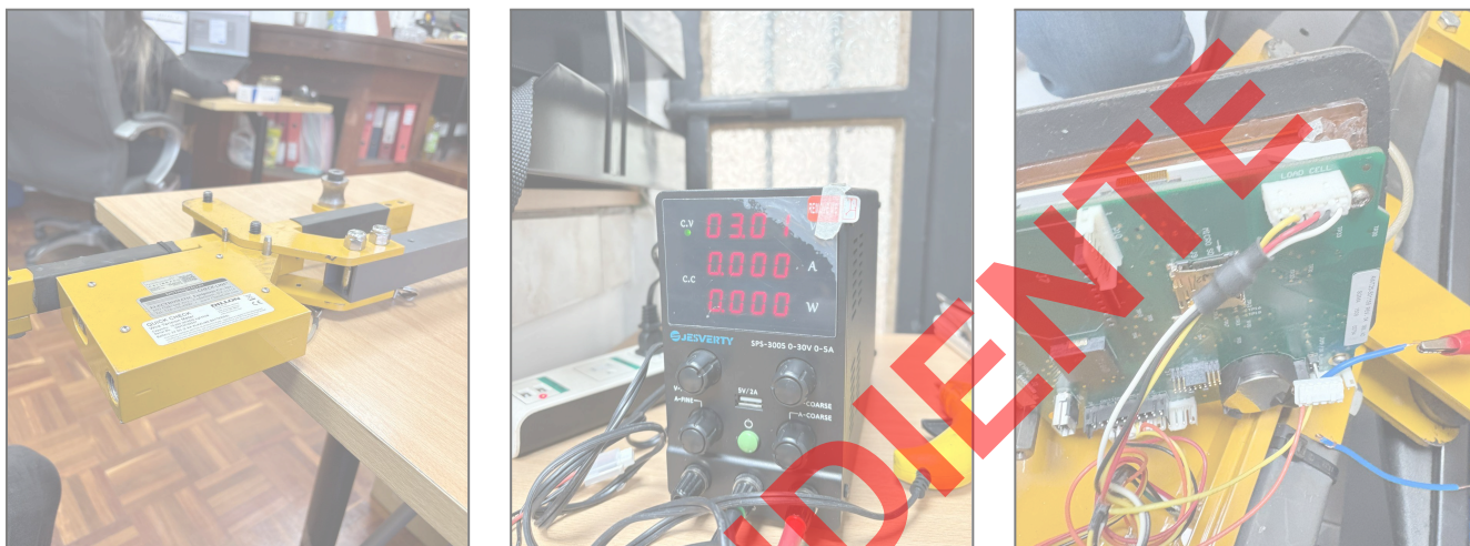
Fig. 1 Revisión técnica