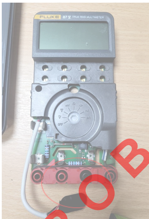
Figura 3. Vista frontal del equipo.