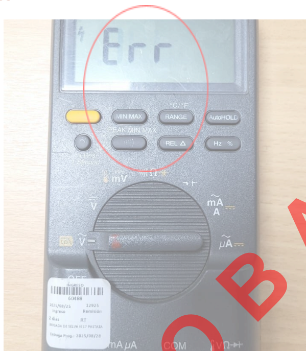
Figura 1. Mensaje del multímetro.