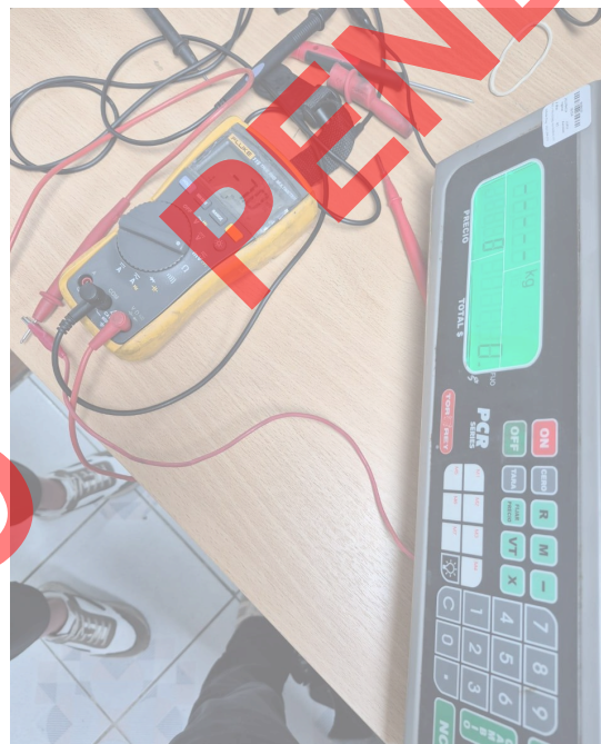
Figura 4. Mensaje en la pantalla de la balanza.