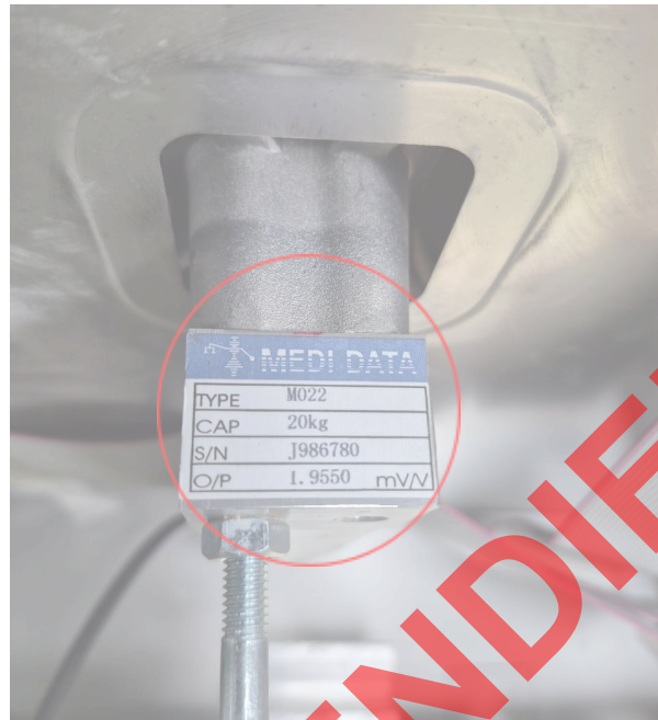
Figura 1. Datos técnicos del sensor.