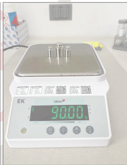
Fig 5. Prueba de carga