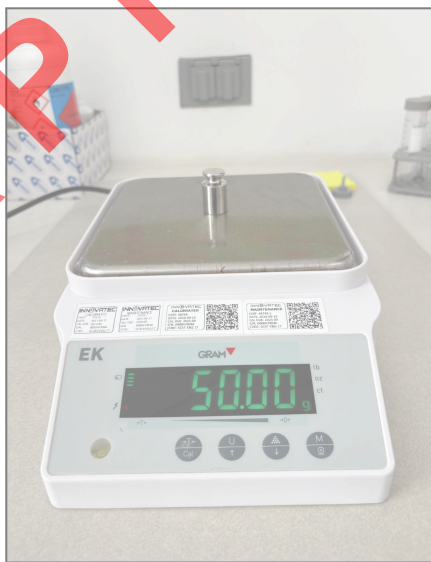
Fig 4. Prueba de carga