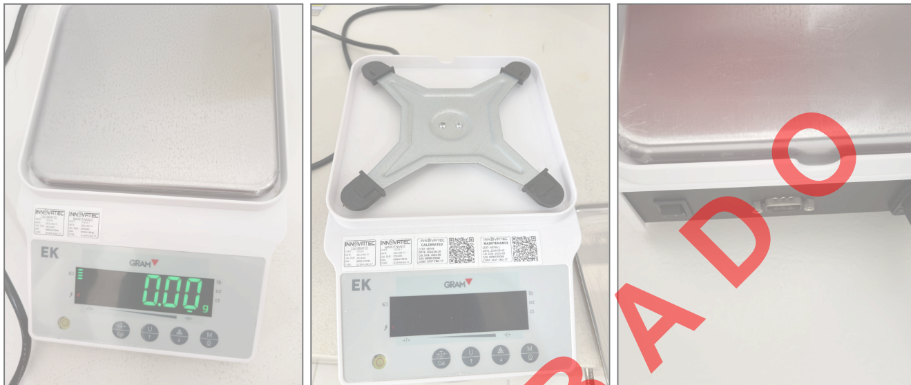
Fig 1. Vista general del equipo (Frontal, Lateral y Posterior)