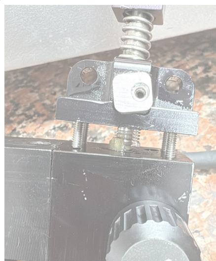
Fig. 1 Mantenimiento del Equipo