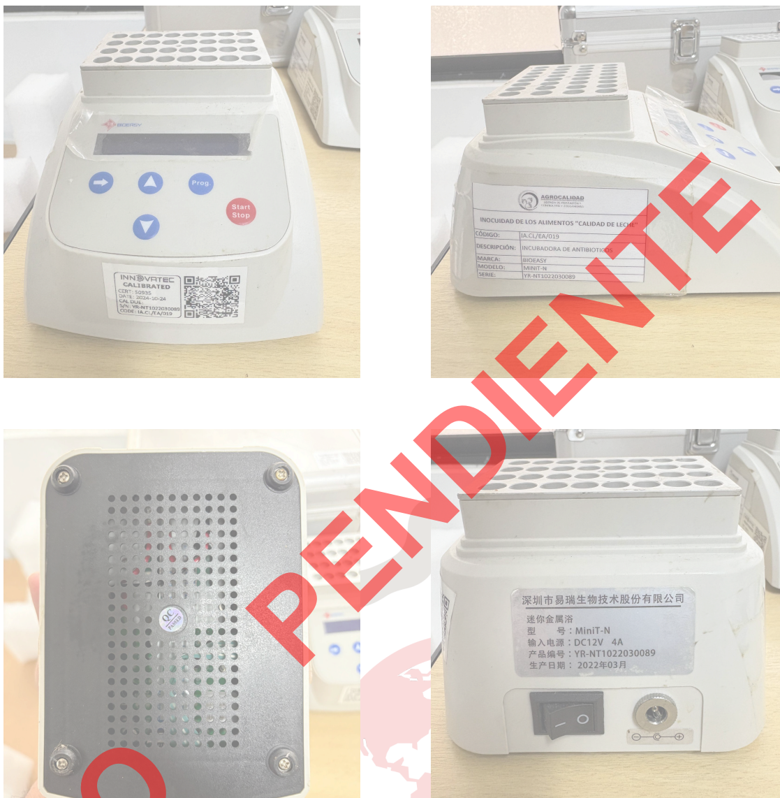
Fig. 1 Mantenimiento del Equipo