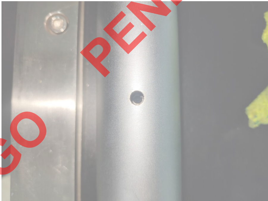
Fig. 3 Tornillo de ajuste atascado