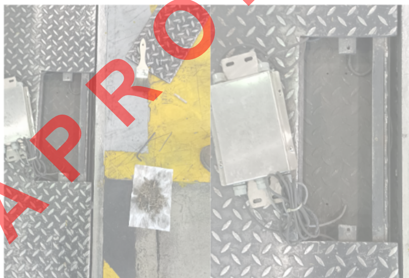
Fig. 1 Mantenimiento del Equipo