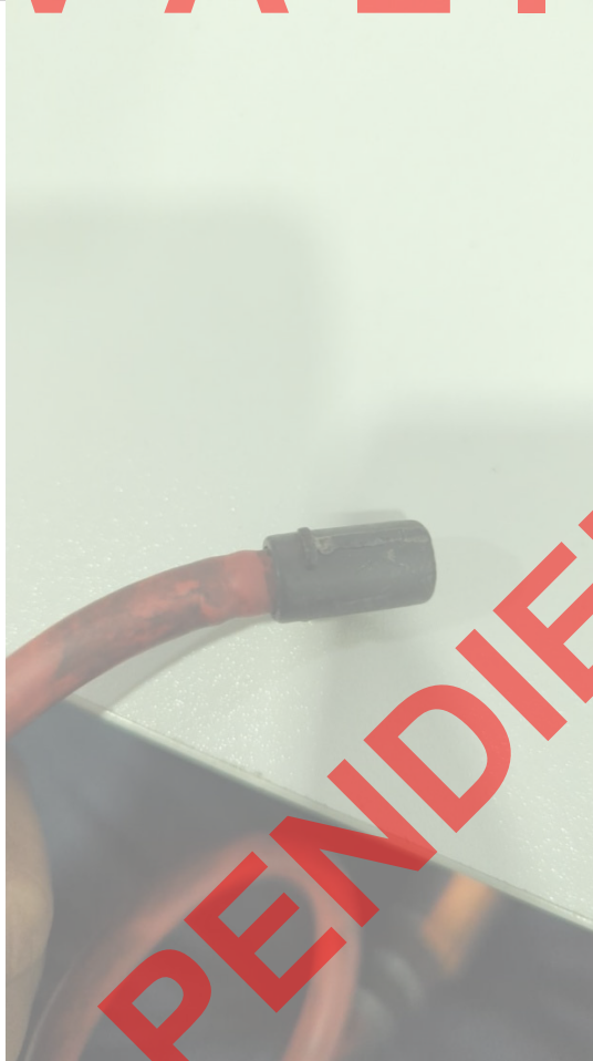
Fig 2. Posible Punto de quiebre del elemento captor de corriente