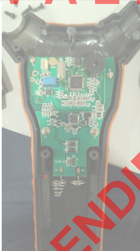
Fig 1 Revisión de placa, no se evidencia corrosión alguna