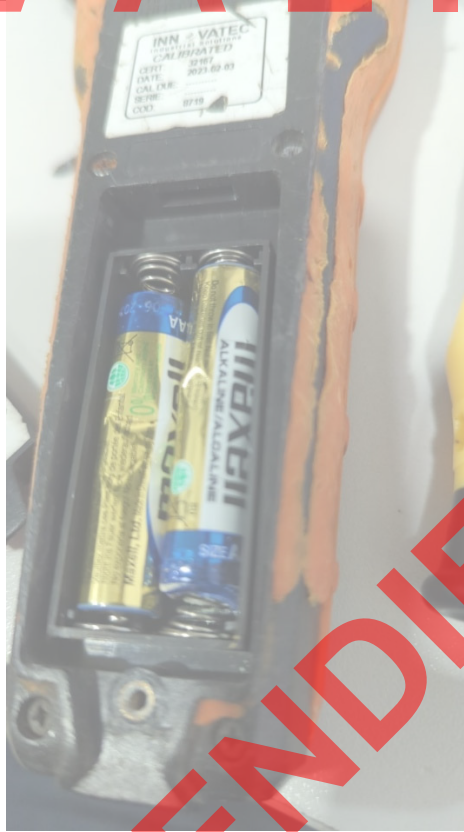
Fig. 3 Baterías deformadas