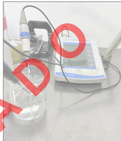
Fig. 1 Vista general del equipo