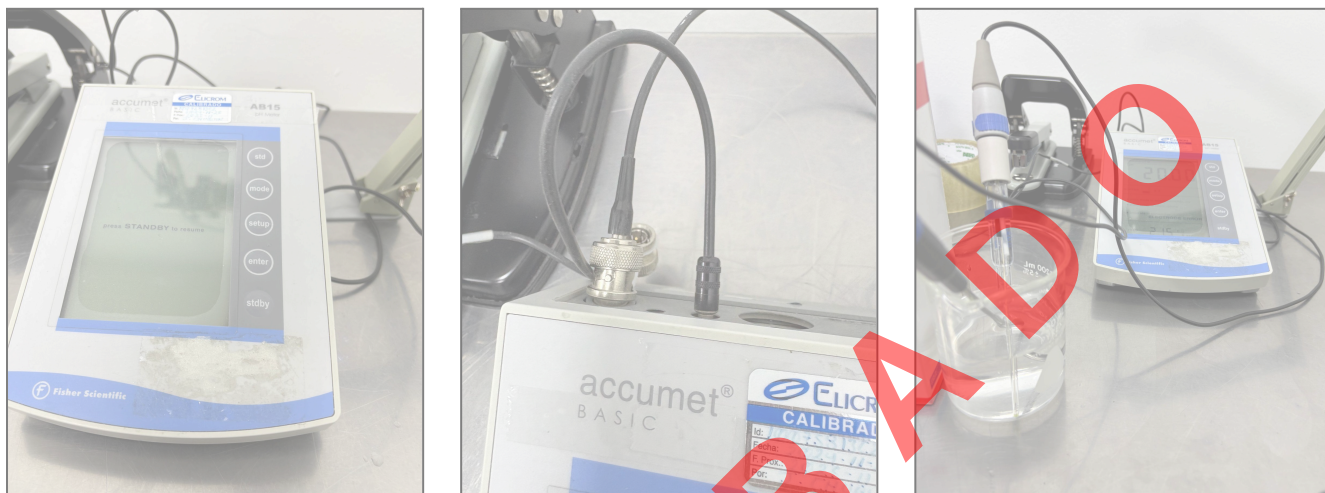
Fig. 1 Vista general del equipo