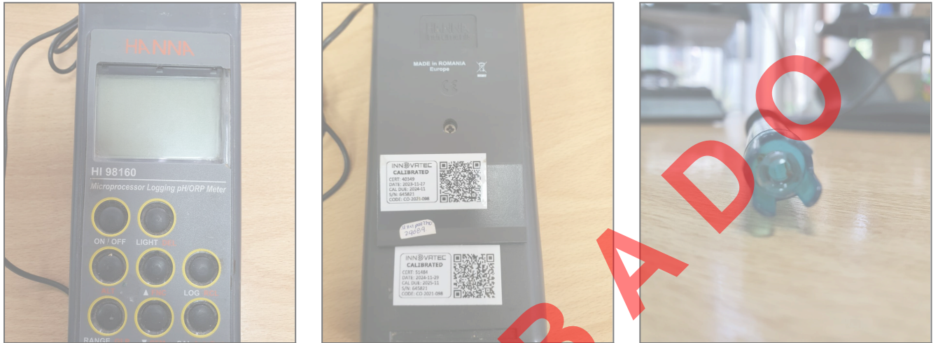
Fig. 1 Vista general del equipo