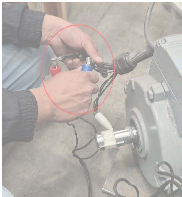
Figura 1: Conexión con el motor trifásico.