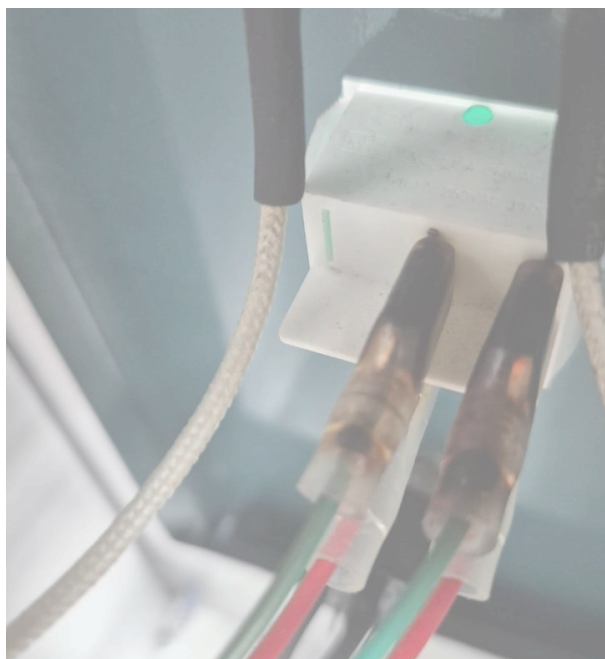
Figura 1: Muestra de que sufrió un pico de voltaje.