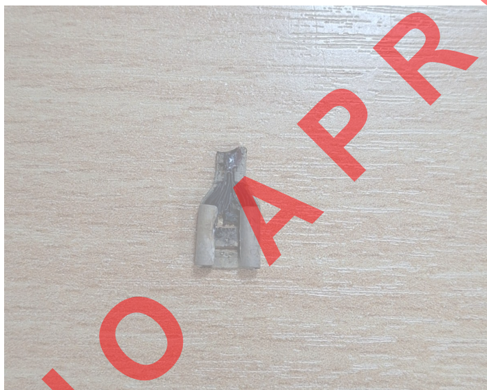
Figura 3: Parte dañada.