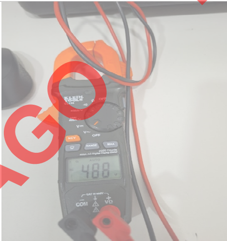
Imagen 5.0 Pruebas de tensión a 480 Vac