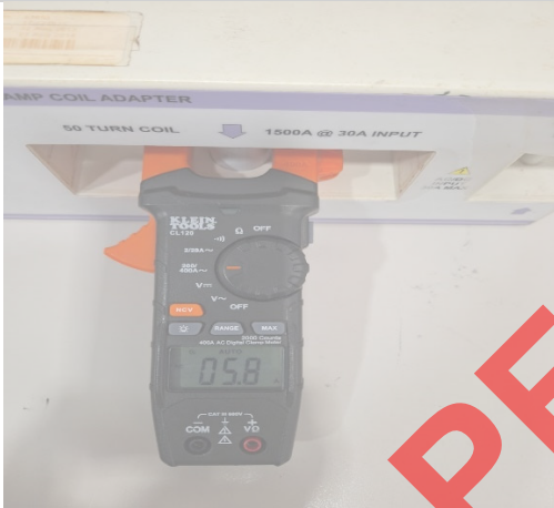
Imagen 3.0 Pruebas de corriente a 6 Aac