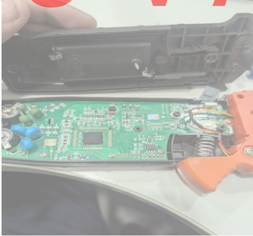
Imagen 1.0 Revisión de terminales de batería.