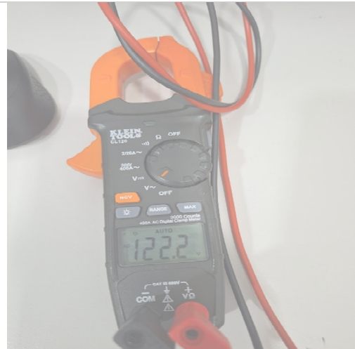
Imagen 6.0 Prueba de tensión a 120 Vac