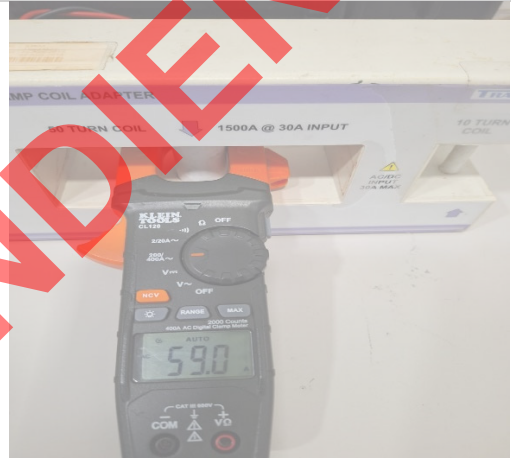
Imagen 4.0 E Pruebas de corriente a 60 Aac