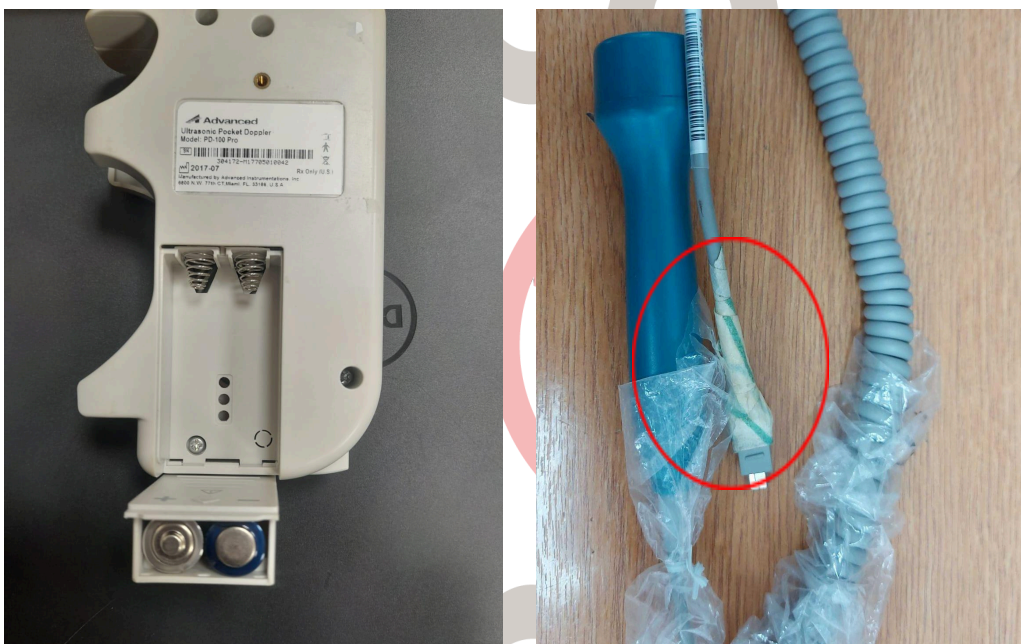
Figura 2. Parte eléctrica y daño en recubrimiento del sensor.