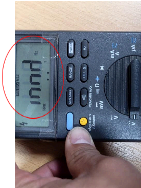
Figura 3. Visualización incompleta de la pantalla.