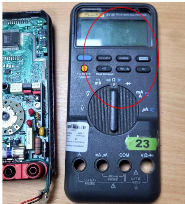
Figura 1. Vista de la placa electrónica como de su pantalla.