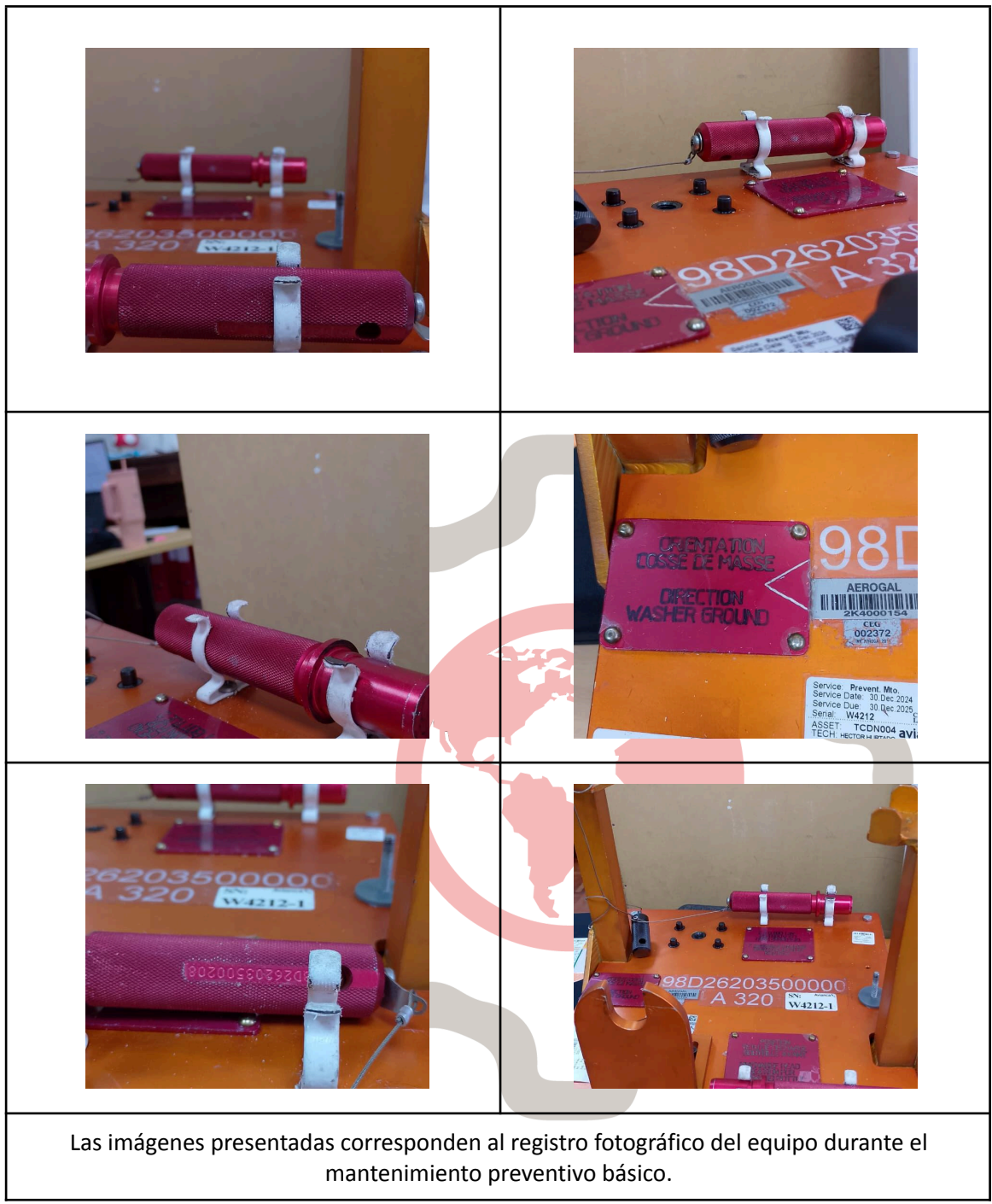
Las imágenes presentadas corresponden al registro fotográfico del equipo durante el mantenimiento preventivo básico.