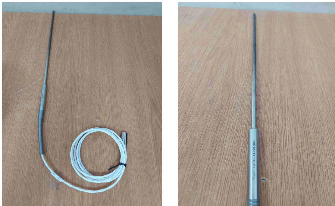
Figura 1. Vista general del equipo.