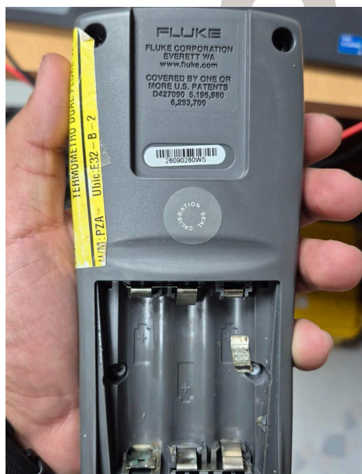
Figura 2. Sección con daño.