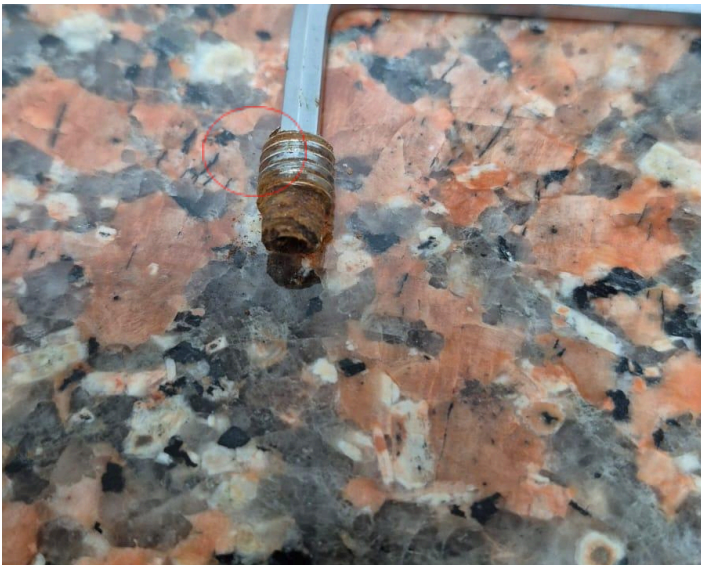
Figura 3: Oxidación