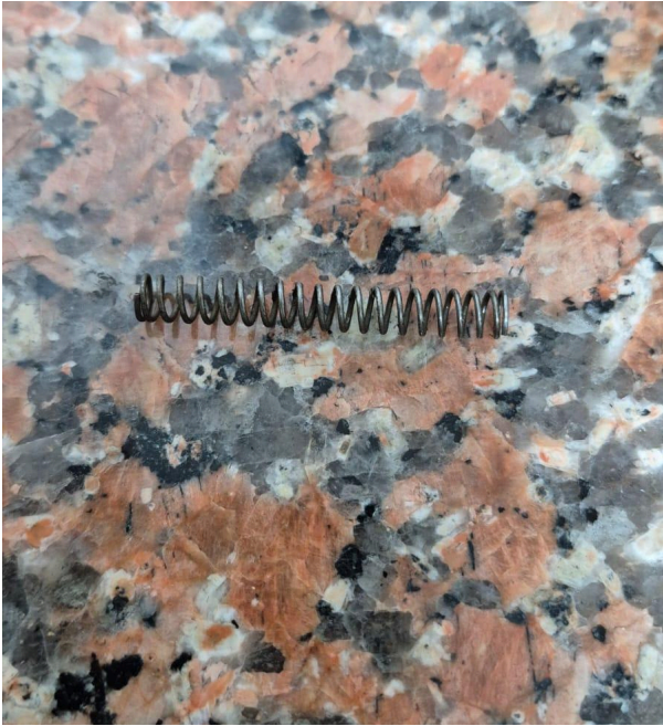
Figura 1: Resorte.