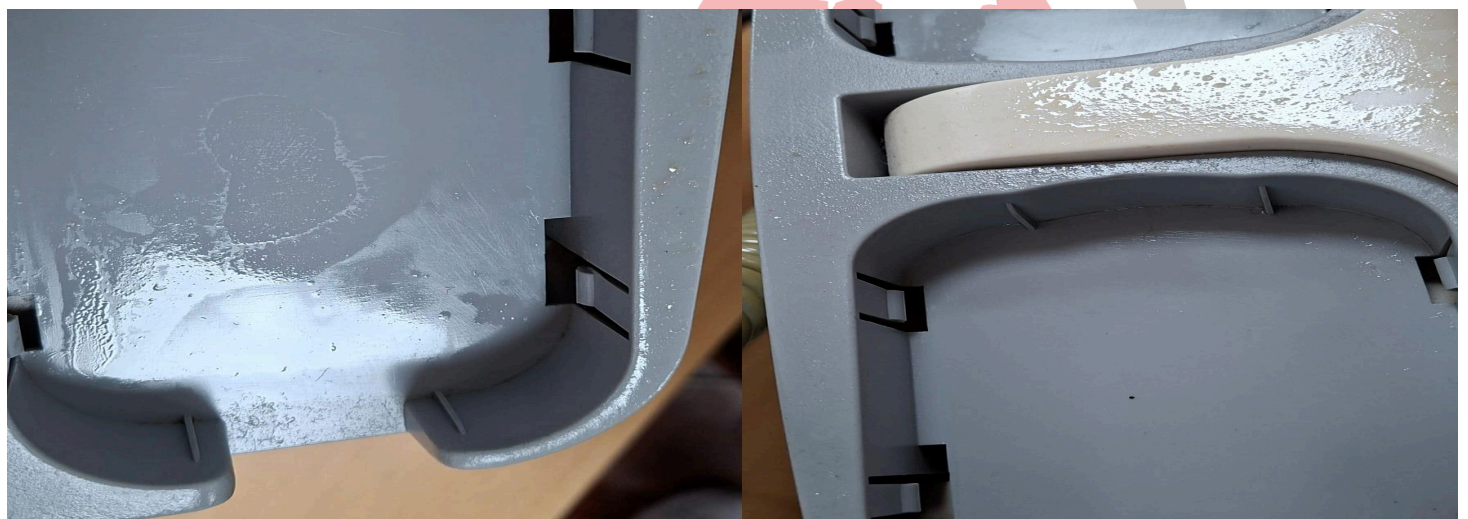
Figura 2. Presencia de aceite en equipo