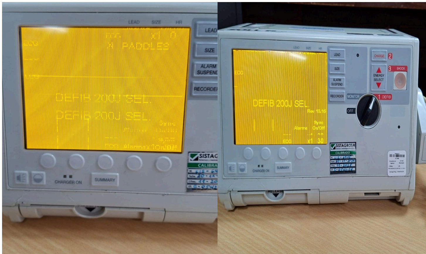
Figura 1. Condición inicial del equipo, donde se evidencia falla en la visualización de la pantalla, presentando distorsión y líneas que afectan la correcta lectura de la información.