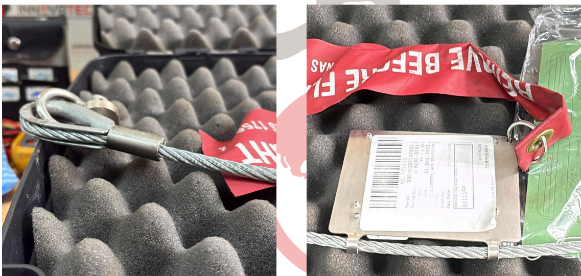
Fig. 2 Mantenimiento