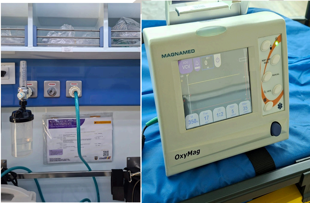
Figura 2.Funcionamiento de equipo