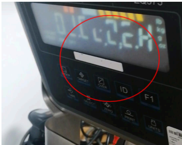
Figura 3: Inicio con display diferente de la balanza.