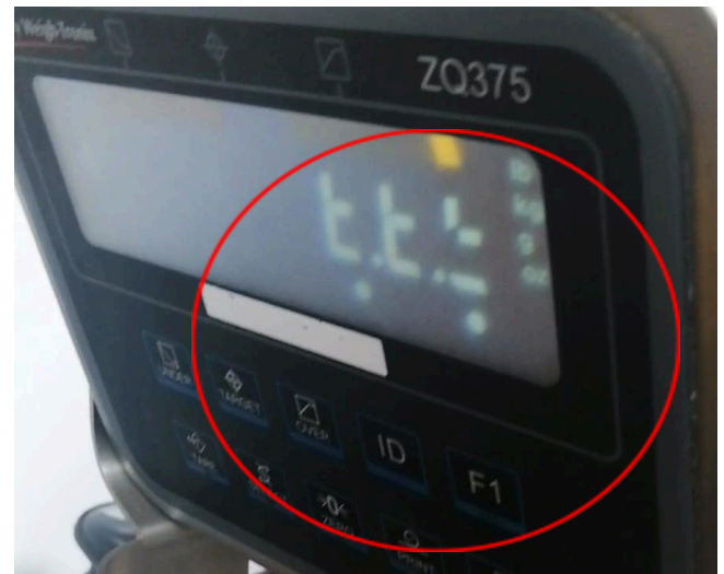
Figura 2: Inicio del display de la balanza