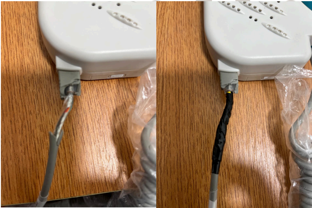
Figura 2. Daño en recubrimiento del sensors.