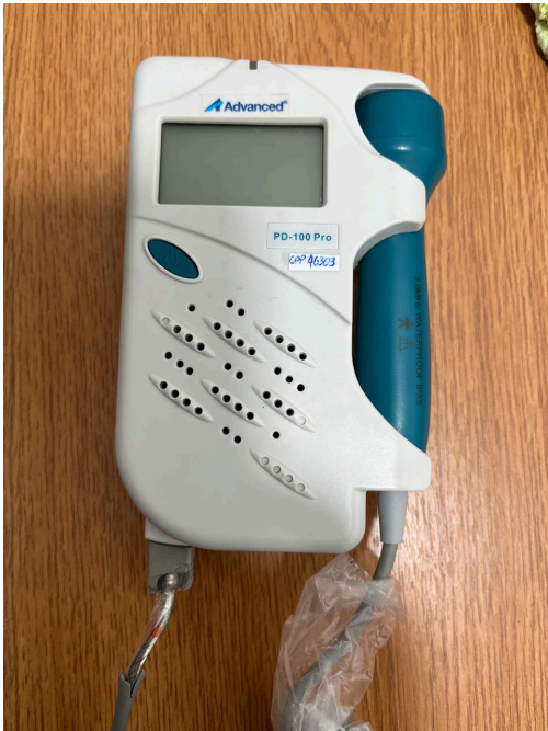
Figura 1. Vista General del Equipo.