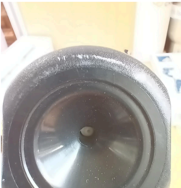
Fig. 2 Compartimento Muestras