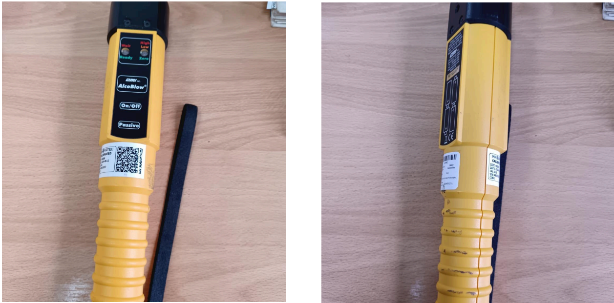
Fig. 1 Vista general del Equipo (Vista frontal y posterior)