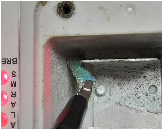
Figura 4. Pieza de contacto rota.