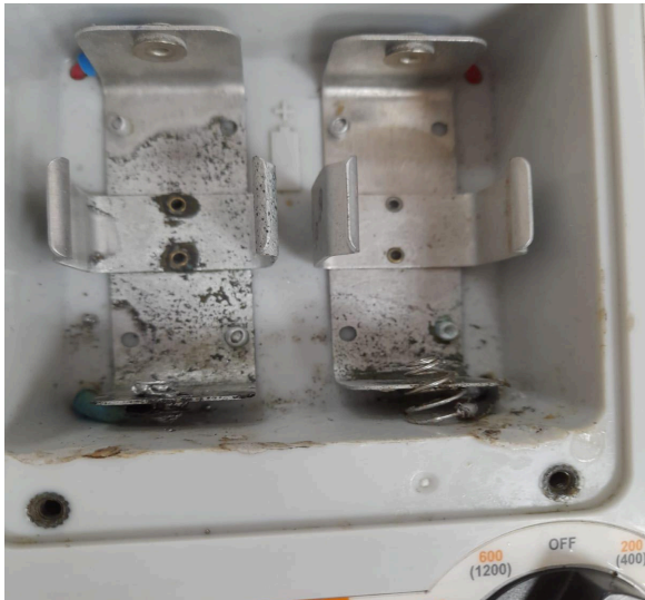
Figura 5. Pieza de contacto rota.