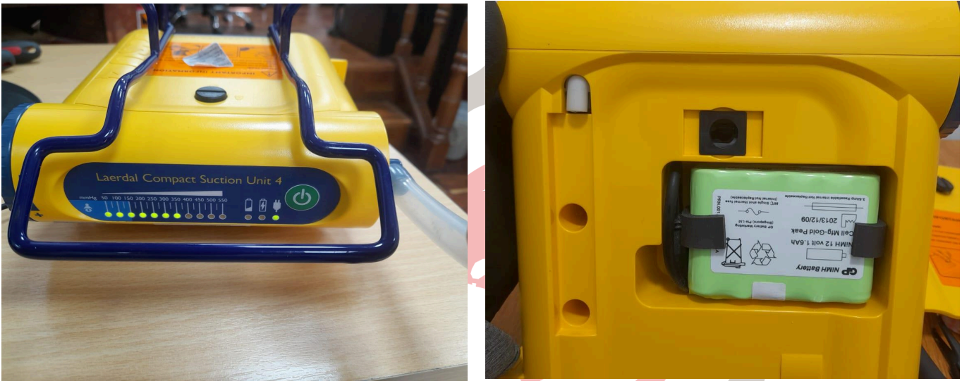
Figura 2. Funcionamiento correcto del equipo