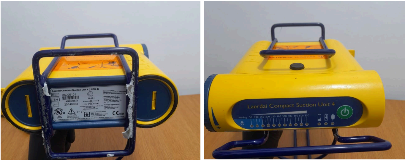
Figura 1. Vista General del Equipo.