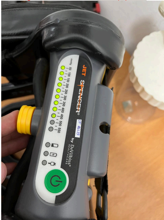
Figura 2. Prueba de Funcionamiento del Equipo.