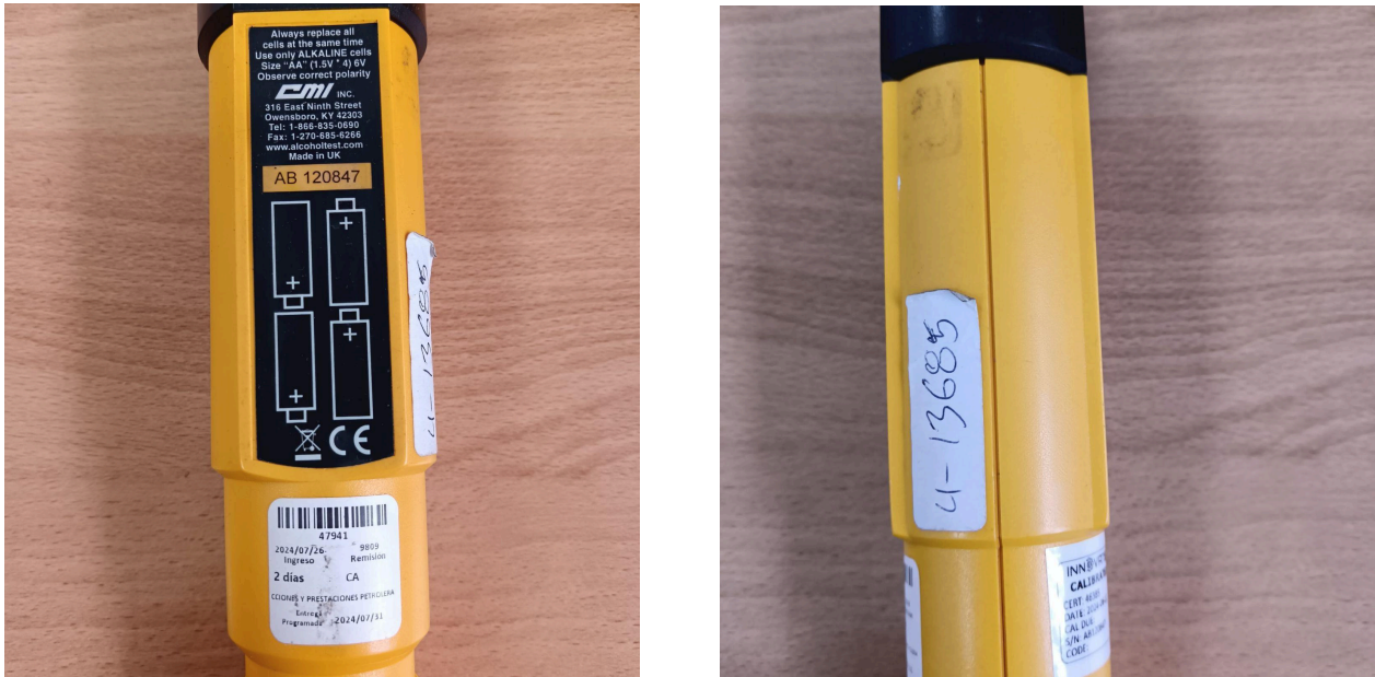
Fig. 1 Vista general del Equipo (Vista frontal y posterior)