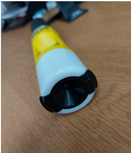
Fig. 2 Vista superior (Boquilla)