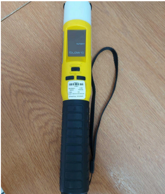
Fig. 1 Vista general del Equipo