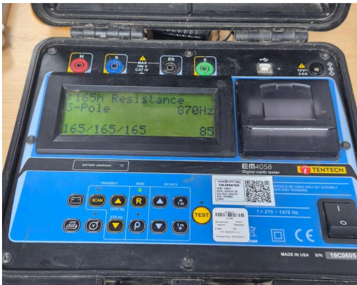
Figura 3: Prueba del funcionamiento del equipo.