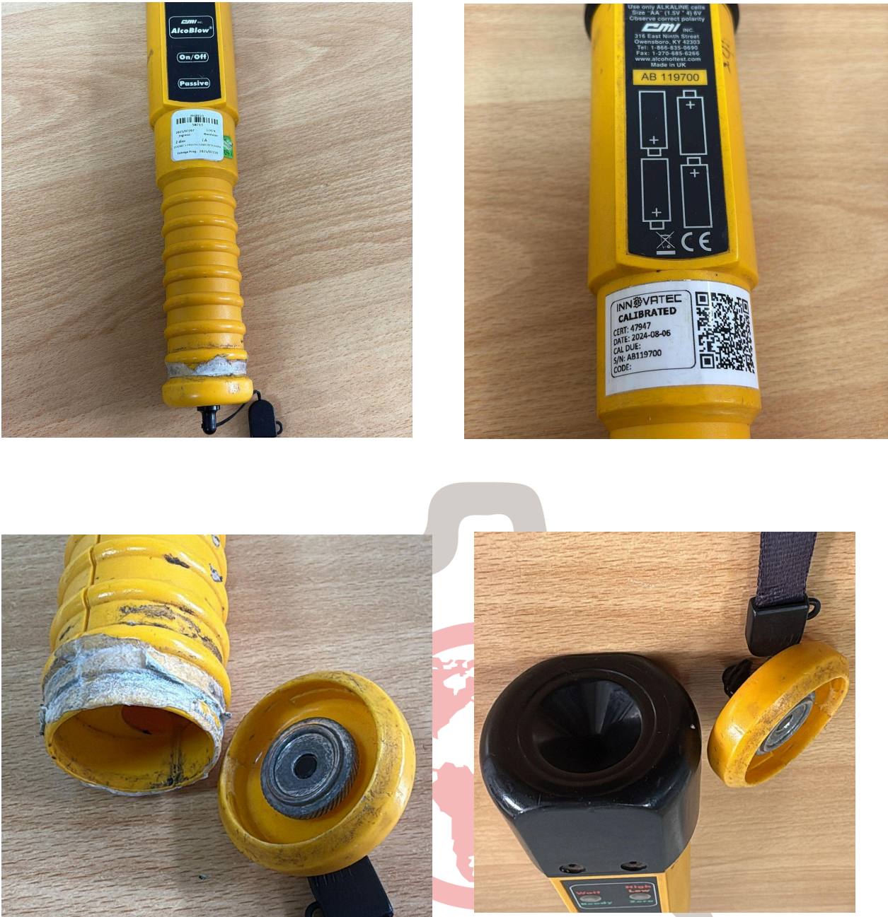
Fig. 1 Mantenimiento preventivo