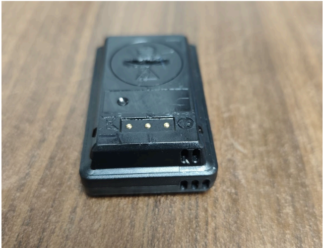
Figura 2. Equipo libre de impurezas