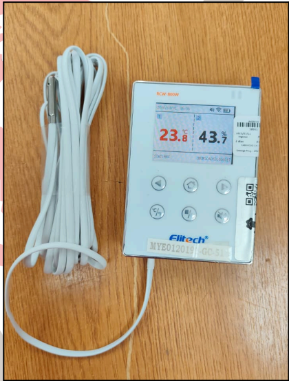
Fig.21 Equipo con otra sonda