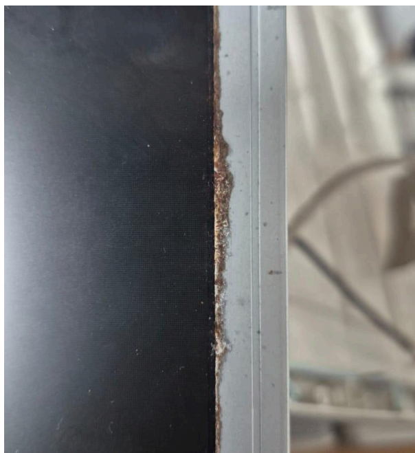
Figura 1: Oxidación en los bordes.