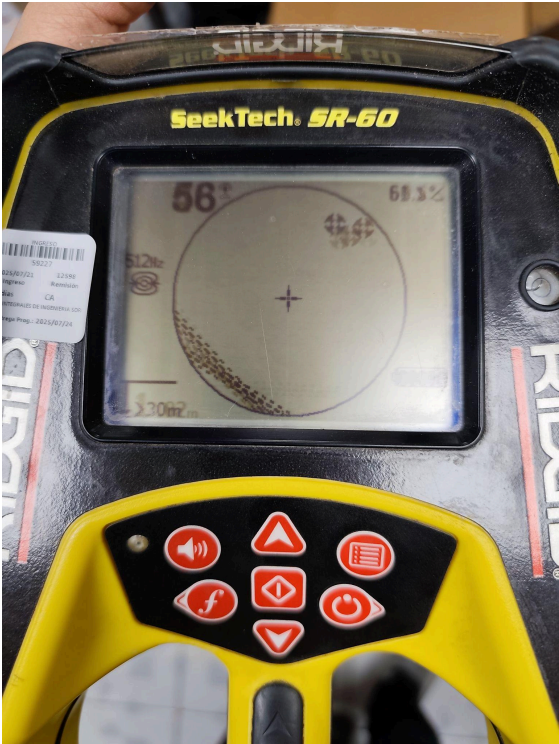
Figura 3. Funcionamiento del equipo.