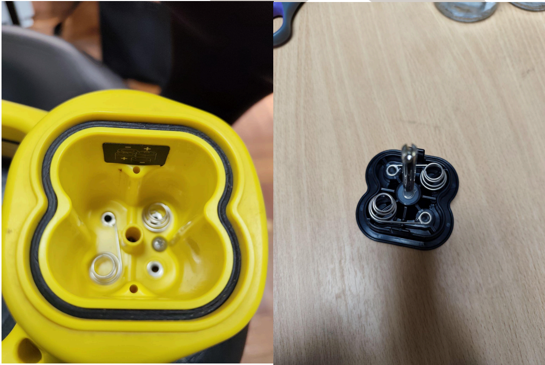
Figura 2. Estado de los bornes del equipo.