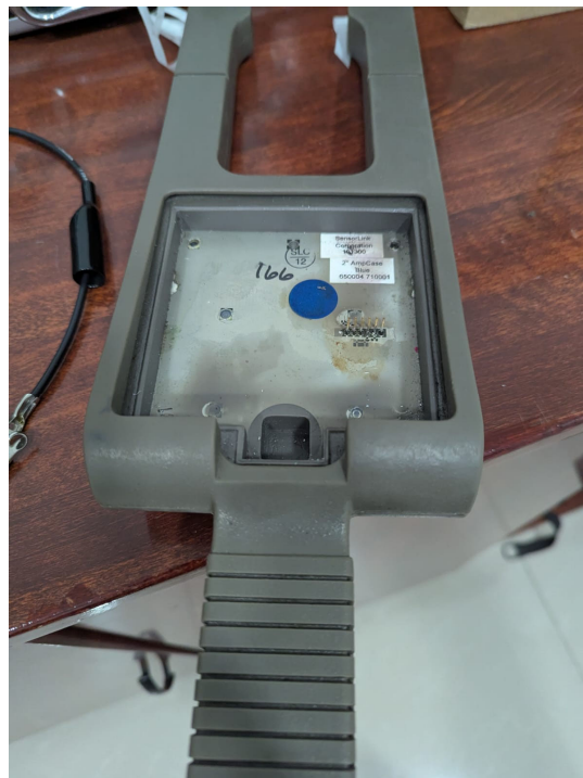
Fig 2. Placa con elemento medidor defectuoso