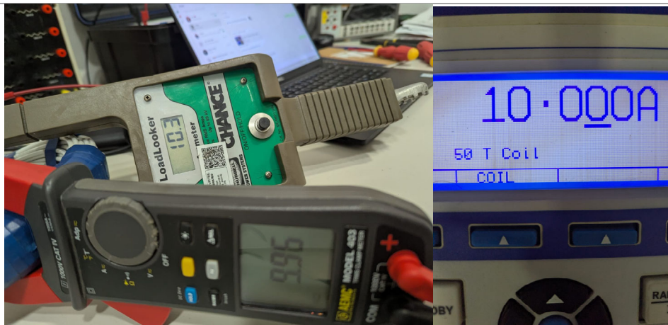
Fig 3 Prueba rápida a 10A, equipo vuelve a medir con normalidad